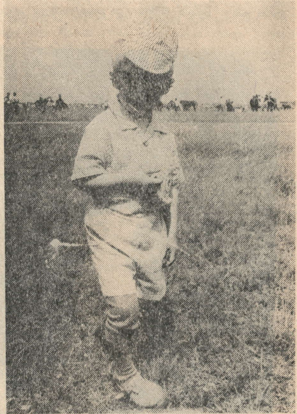
Тагын килер әле Сабан туйлары...

Кабат исегезгә төшерәбез: «Дуслык», «Друж- ба», «Туслах» район газетасына язылу дәвам итә. Газетага үз вакытында язылып калырга киңәш итәбез. Аның еллык бәясә 78 сум.