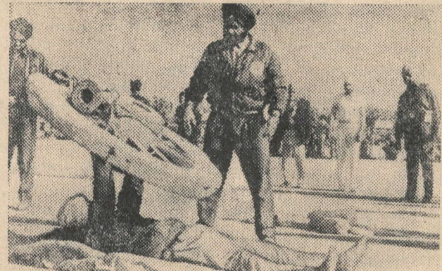
Һиндиядә уңыш җыеп ле ярышлар уздырыла. алу вакытында традиция РӘСЕМДӘ: 65 яшьлек буенча ярминкәләр, фес- Синх 100 килограмм тивальләр үткәрелә. Ала- авырлыктагы көпчөкне да, кагыйдә буларак, тәр- жиңел күтәрә.