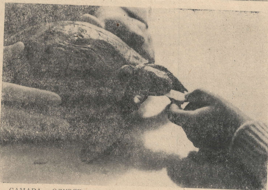
САМАРА ӨЛКӘСЕ. Буш вакытта нәрсә белән шөгылләнәргә? Тольятти шәһәренең балалар һәм үсмерләр иҗаты йорты

каршындагы зоологик тү-гәрәккә йөрүче балалар-ның жавабы эзер: билге-лә, үзләренең яраткан хайваннарын карыйлар.