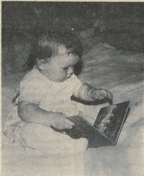
Кая, яшел тышылы китап ни язган икән?

(Мәскәү) — «Динамо» 10.30 «Сергей Радонезский». 1 фильм. (Мәскәү). 20.45 Тыныч йокы, нәниләр. 21.35 КВН-92. 12.15 Ничек яшәрбез.