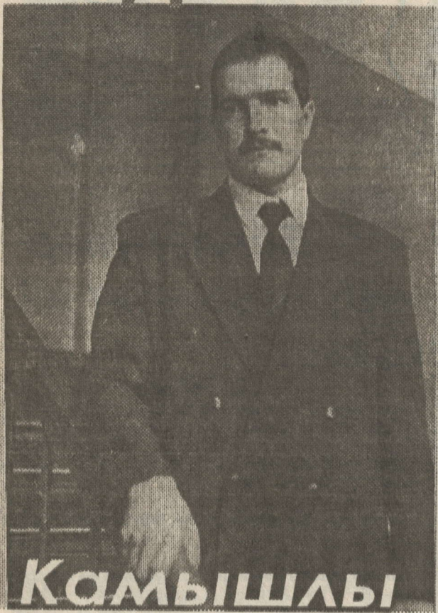
Камышлы Николаевы ул

Рәсемгә кияү егетедәй киенеп - ясаный төшкән, чибер ир - аткәм дисәзмә? Николаев ул. Мичурин исемдәге КХАның гына түгел, тулаем районның танылган кәшәсе - былел СК - 5 комбайны белән иң күп ашык суктыручы Николаев бу.