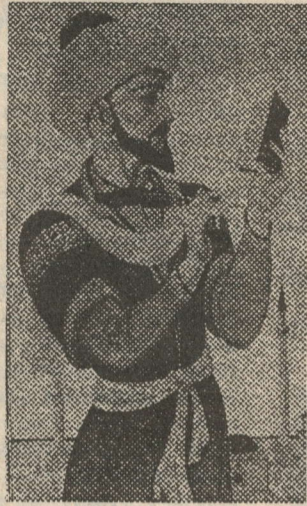
Елы дип игълан ителде. Мондый карар өчен

II Бөтендөнья татар конгрессы программасына аның мөһим эшләрнен берсе итеп урта гасырлар шигъриятебезнең якты йолдызларыннан булган Мөхәммәд'ярның 500 еллыгын тантаңлы төстә билгеләп үтү кертелде.