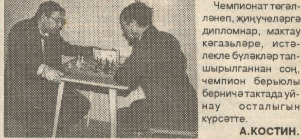
Чемпионат төгәлләнен, җиңүчеләргә дипломнар, мактау кәгазьләре, иста-лекле бүләкләр тапшырылганнан соң, чемпион берьюлы берничә тактада уйнау осталыгын күрсәтте. А.КОСТИН.

Команда беренчелегендә урыннар түбәндәгечә бүленде: НГДУ, «Локомотив» (тимер юл), «Сельхозтехника» берләшмесе.