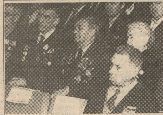
Көрәшләрдә алда булганнарның урыннары бүген ин түрдә.

1918 елның 18 февралендә немец гаскәрләре сугыш хәрәкәтләрен башлап жиберәләр. Бериндә каршылыкка очрамакчы диярлек алар фронтның бөтен сызыгы буенча һөжүмгә күчәләр һәм Двинскны ала-лар. Хал сәгатә белән кыеплана бара. Немеллар Псковны килеп житәләр. 18 - 21 февралда дошман гаскәрләре, Украина, Белоруссияне, Балтыйк буенгы шактый өлешен яулап алып безнең территориягә керәләр. Рус армиясенен калдыклары тәртинсез рәвештә чигенәләр.