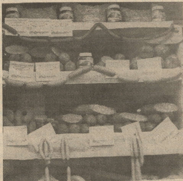
«Норлат - Октябрь ит комбинаты» акционерлык жәмгыяте эшлән чыгара торган продукциядә авыл хезмәткәннәренен дә өлеше гаят салды.

Киекледә исә алардан бик азга, 2 генә центнерга калыптылар.