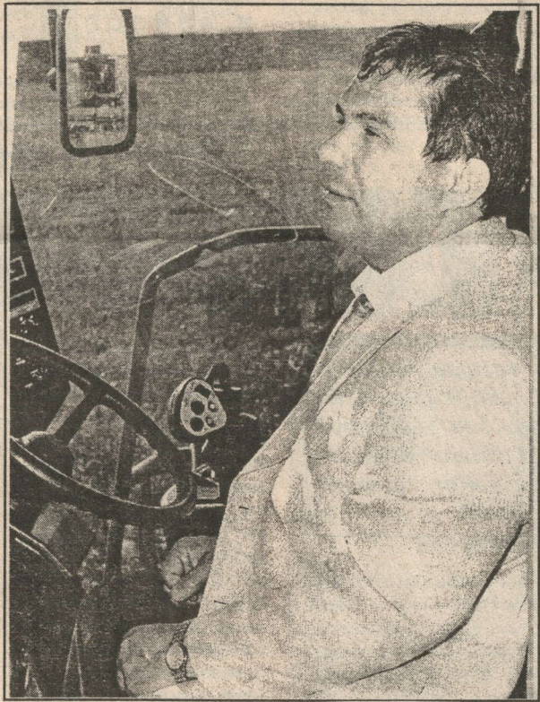
Рәсемнәрдә: Хөкүмәт башлыгын һәркайда кунакчыл каршы алдылар; "Кейс" кабинасындагы уңайлык Премьерны да таң калдырды.