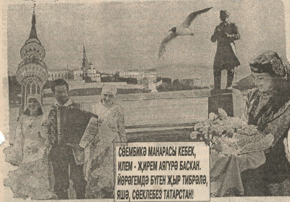
СӨЕМБИКӘ МАНАРАСЫ КЕБЕК, ИЛЕМ - ЖИРЕМ АЯГУРӘ БАСКАН. ЙӨРӘГЕМДӘ БУГЕН ЖЫР ТИБРЭЛӘ, ЯШӘ, СӨЕКЛЕБЕЗ ТАТАРСТАН!

30 август - Татарстан Республикасы мөстәкыйльлеге көне