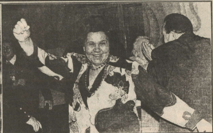
Рәсемнәрдә: Ветераннар Советының элеккеге һәм яңа рәисләре; очрашу өнә шулай күңелле үтте.

бызның бүгенгесендә булуын үз күзләре белән күрергә мөмкинлек тудыру, икенчедән, хужалыкларда эшнәң ничек оештырылуы, үзгәртеп коруларның барышына карата аларның гадел фикерләрен һәм акыллы киңәшләрен ишетү иде. Картлар сүзен капчыкка сал, дип бер дә белмичә генә әйтмәгәннәр бит борынгылар. Ә ул көнне сәфәр чыккан ветераннар арасында сүз - киңәшләрен чыннан да капчыкка гына салып, кирәге чыккан саен киңәшкә тотардай аксакаллар байтак иде. Берничә колхоз рәисенең әйткән сүзләрен кайбер бүгенге житәкчеләр капчыкка салудан бигрәк колакларына киртләп куйсыннар дип аерым басым ясап әйтеп үтмичә дә булмас.