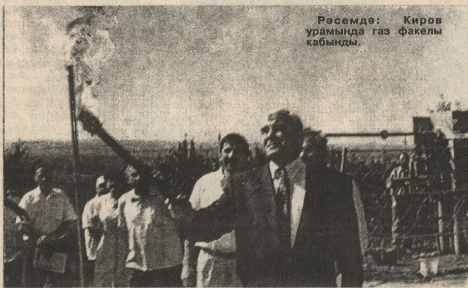
Рәсемдә: Киров урамында газ факелы кабынды.