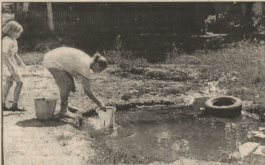
пулашасса шанатпәр. Ку кун каярах үкернә. чәкәнче: йсса пәхам-ха, тен, есәме те юрә...