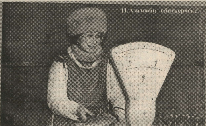
Н. Литовай сәйүкерчөкө.

сөмөсө пасартинчен йүнөрөх хакпа туяма пултарчөс. Хулари предприятисем синчен каласан, комисси членөсене уйрамак чугун сүл ОРСө савантарчө, перемячсем-