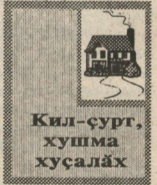
Кил-ҫурт, хушма хуҫальх

Чи малтанах хальх медицини унна терлё чир-чёртен сипленмешкён уса курма сёнет: ўслёкрен, пуре чирёнчен, ревматизман, артритан, ўт-тир чирёсенчен, вар-