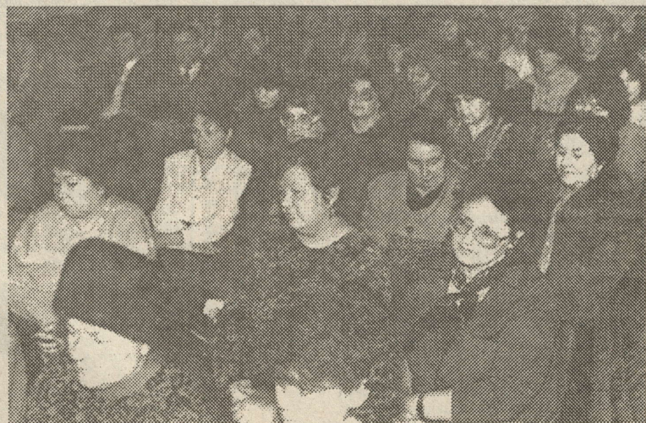
(Пирән корреспондент җулталәк конференцийәнчә җырнә замәткәсене хаҗатән черетлә номерәсенчен пәринче вулар).

онарлә медицина пулшәвә парассине усәллә йәркелемелле тата профилактика,