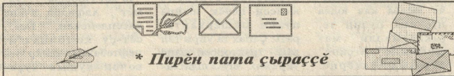
* Пирён патта сырашсё