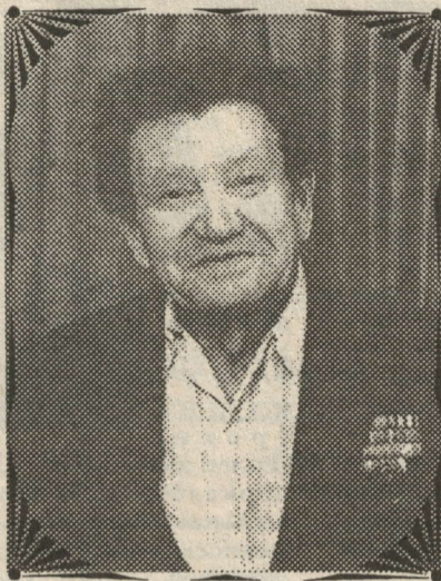
Пирён өмөре Тәсчәр ентешем.

Таймануҗ сана Сөре ситиччен. Ан ман таврана Лере кайиччен.