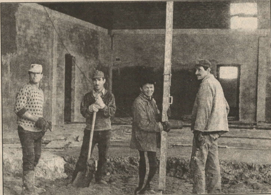
Камениксемпе монтажниксен кашни кунах ес нумай. Сак укерчекри 547-меш номерле кусса сурекен механизацилене колонна есчненесе те саван пекех. Вбсем Тернесри спирт заводенче сене котельнй тавасше.