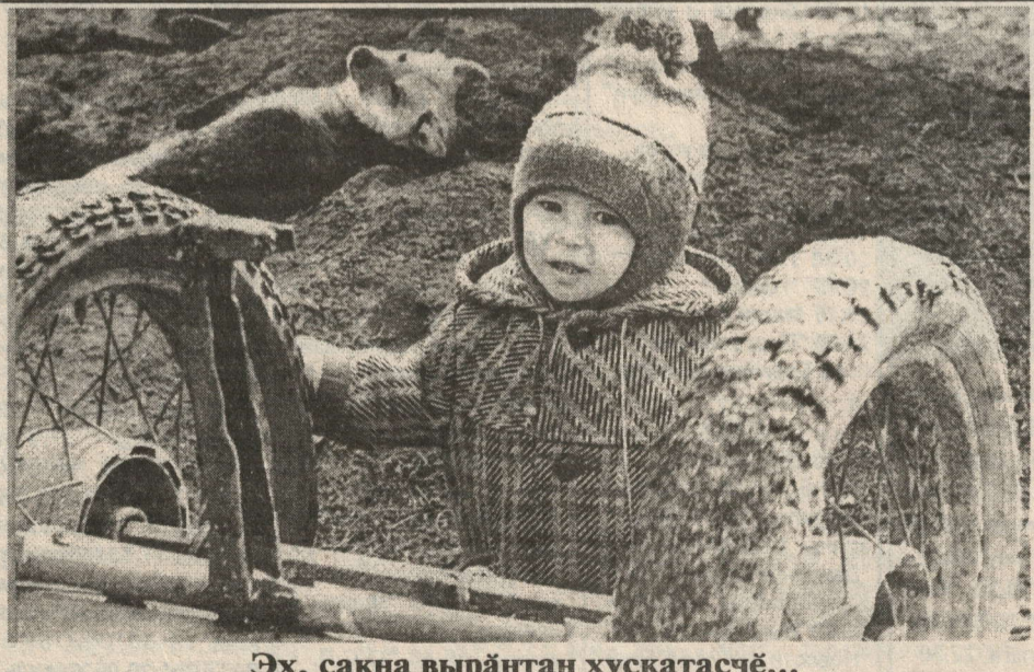
Әх, сәкна вырәнтан хускатасчә...

Хваттерти йывәр сәтелпукан айне кивә утиял хурса та куҗарма пулат, урай хәмисем те шәйрәлмасә.