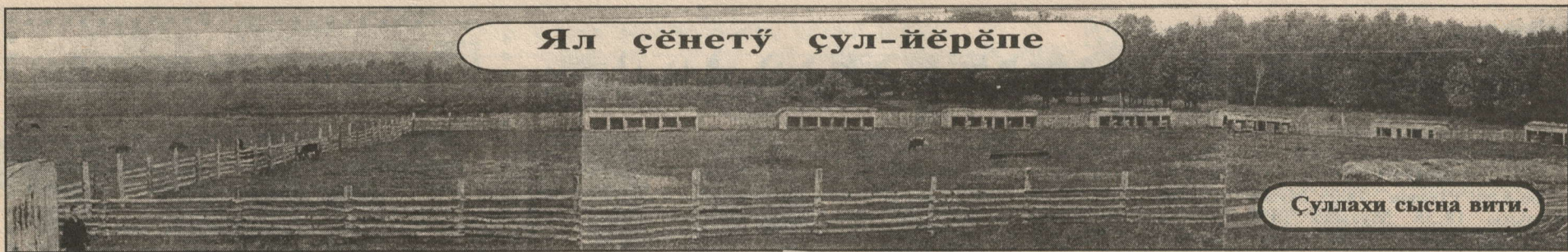
Суллахи сысна вити.