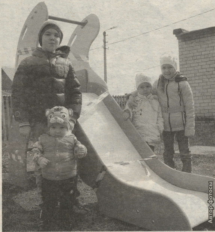
Мәйданчыкка балалар аеруча шат

Нефтьчеләр урамының 14нче йортында яшәүче балаларга уйнау урыны эзләрәк йөресе булмагачк хәзер, чөнки шул көннәрдә биредә заманча жайланмалы уен мәйданчыгы корып куйдылар.