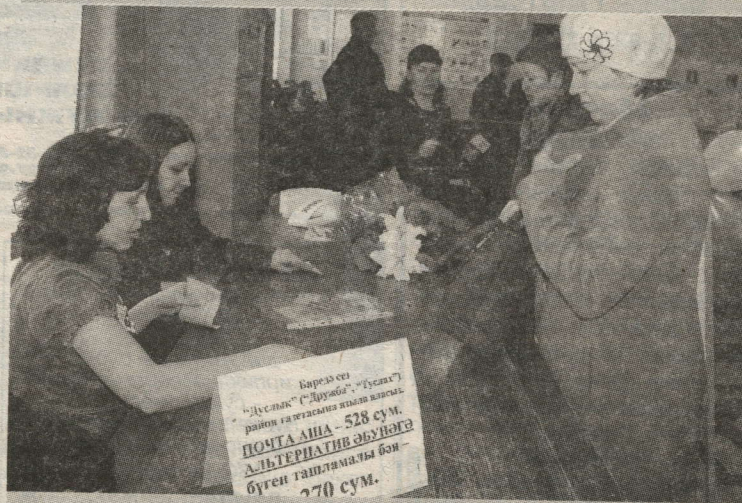
“ДУСЛЫК”КА ЯЗЫЛМЫЙ БУЛМЫЙ, ДИДЕЛӘР ӘБУНӨЧЕЛӘР