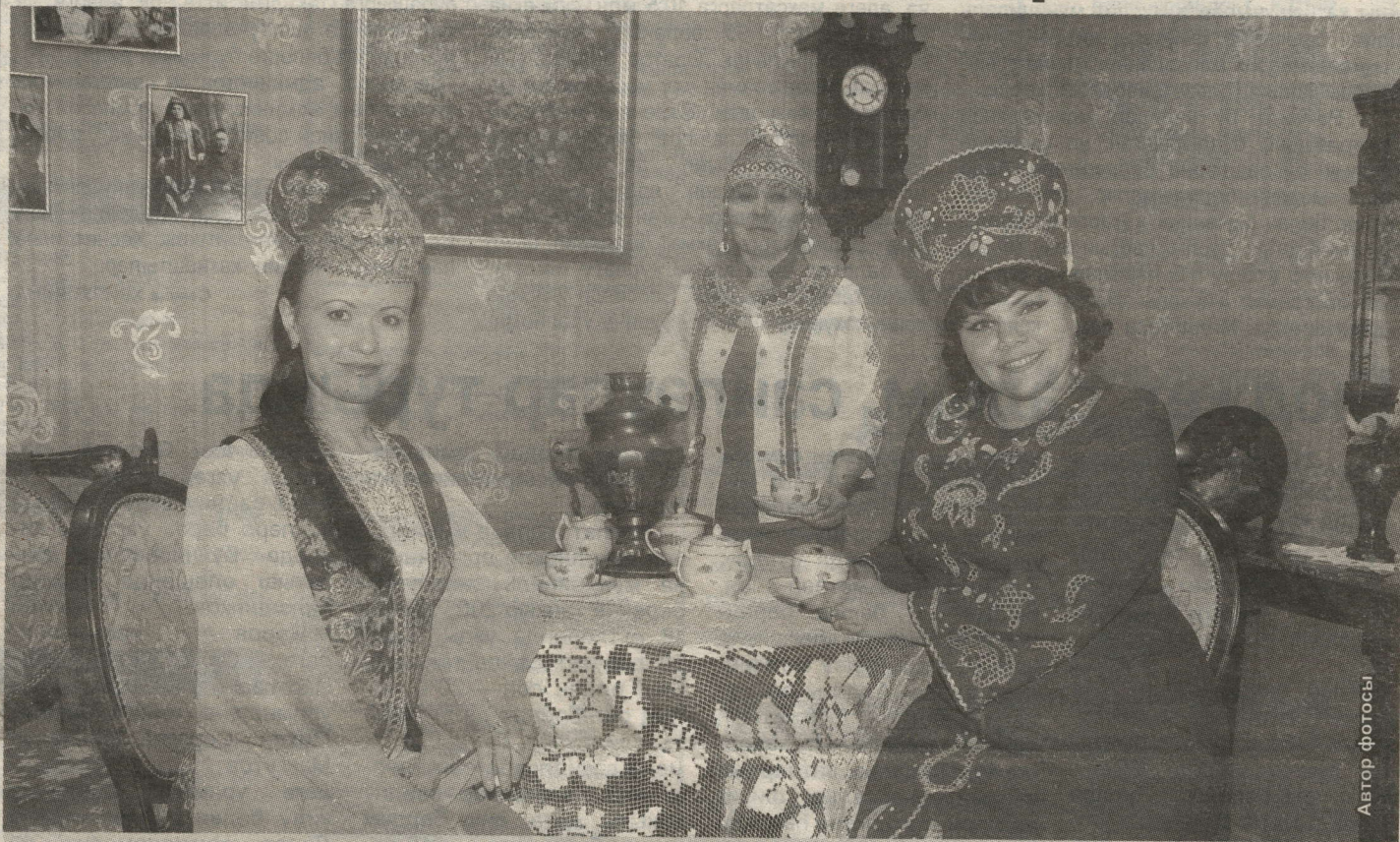
НУРЛАТТА ТӨРЛЕ МИЛЛӘТ ХАЛЫКЛАРЫ КИЛӘШЕП ЯШИ

Татарларда – туган тел. Чувашларда – таван чөлхә. Русларда – родной язык... Бу сүз төрле телләрдә төрлечә яңгыраса да, асылы бер: тел – милләтнең сакчысы.