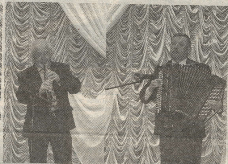
ГОБОЙ ҺӘМ БАЯН МОҢЫ КҮҢЕЛЛӘРНЕ ИРКӘЛӘДЕ