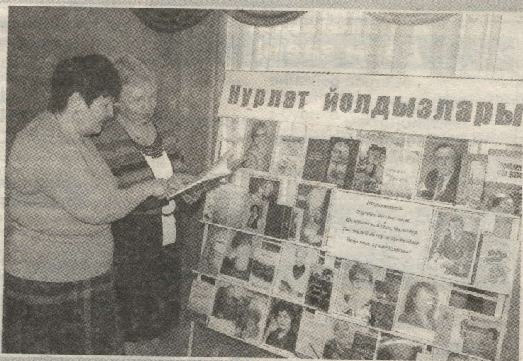
НУРЛАТ ЙОЛДЫЗЛЫГЫ КИҢӘЯ, АРТА БАРА