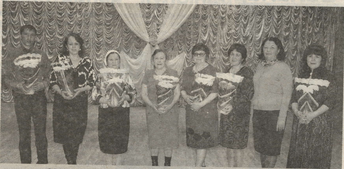
ӘДӘБИ ОЧРАШУ ЧӘЧӘКЛӘР ҺӘМ “ТУГАН ТЕЛ”НЕ КҮМӘКЛӘП ҖЫРЛАУ БЕЛӘН ТӨГӘЛЛӘНДЕ