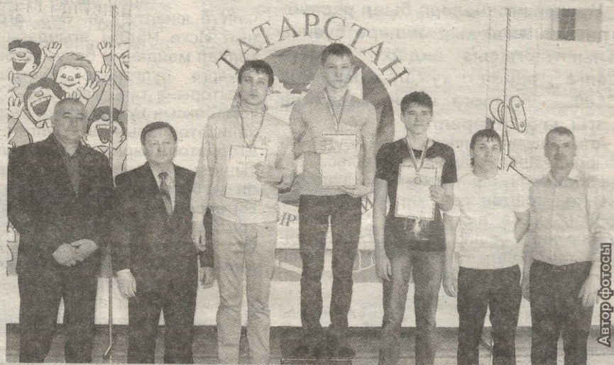
ИҢ ОСТА ЙӨЗҮЧЕЛӨР БҮЛӨКЛӨР АЛДЫ