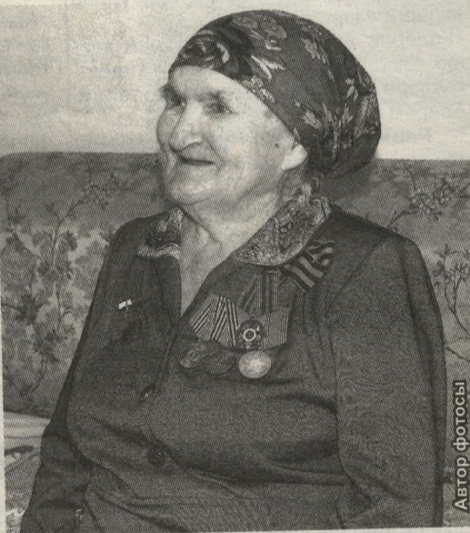
ФЕКЛА ГОРШКОВАГА КАРАП "СӨБХАНАЛЛА" ДИЯРГӘ БУЛА

– Быел Чурабатырга юл салабыз, аннан соң Кызыл Юлга то-