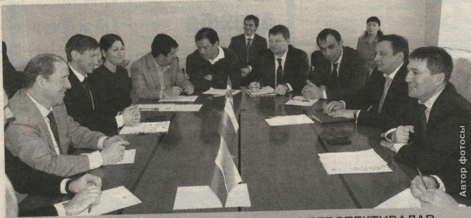
ЭШЛЕКЛЕ СӨЙЛӘШҮ БУРЫЧЛАР ҺӘМ ПЕРСПЕКТИВАЛАР ТУРЫНДА БАРДЫ

Иң зур чыганаclarыннан берсе Нурлат районнда булган "Татнефтеотдача" жәмгыяте яңа технологияләр кертеп эшләргә ниятли.