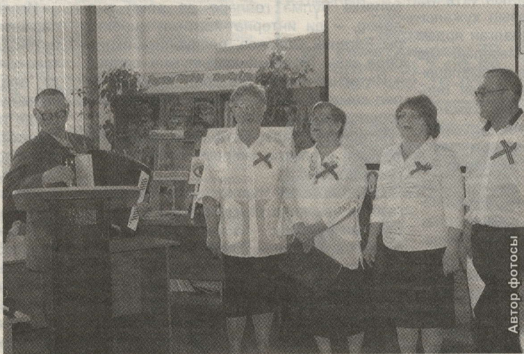
ОЕШМА ӘГЪЗАЛАРЫ КОНЦЕРТ ТА ӘЗЕРЛӘГӘННӘР

Бөтенроссия сукурлар жәмгыятенә 90 яшь тулды. Бу вакыйгадан Нурлат жирле оешмасы да читтә калмады, ул узган атнада үз әгъзаларын бәйрәм чарасына жыйды.