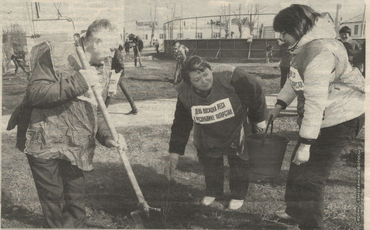
ИГЕЛЕКЛЕ ЭШ ҮРНӨГЕН ШӘҺӘР ҺӘМ РАЙОН ЖИТӨКЧЕЛЕГЕ — «ПРЕЗИДЕНТ БЕЛӘН БЕРГӘ» ХӨРӘКӘТЕ АКТИВИСТЛАРЫ БЕРЕНЧЕ БУЛЫП КҮРСӨТТЕ

Нурлатлылар «Президент белән бергә» Татарстан хәрәкәте 20 апрельдә игълан иткән игелекле эшләр эстафетасына актив кушылдылар.