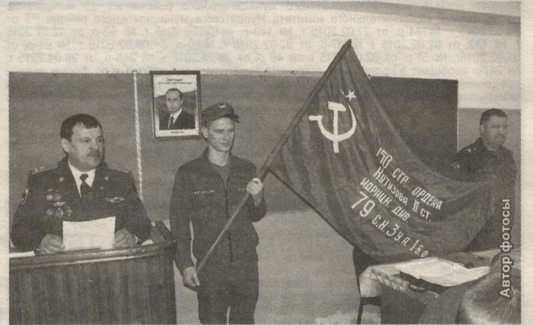
ЖИҢҮ БАЙРАГЫ КҮЧЕРМӘСЕ ГИМНАЗИЯ МУЗЕЕНДА САКЛАНЧАК