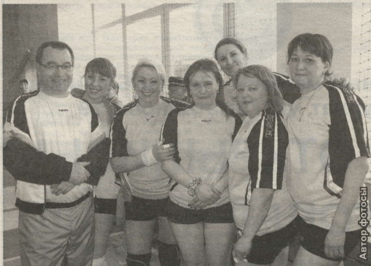
ХАСТАХАНӘНӘН ХАТЫН-КЫЗ ВОЛЕЙБОЛЧЫЛАРЫ КОМАНДАСЫ БАШ ТАБИБ БЕЛӘН

Икееллык тәнефестән соң, медицина хезмәткәрләренең "Сәламәтлек-2015" спартакиадасы старт алды. Медиклар соңгы тапкыр үз коллегалары белән спорт майданчыгында 2012 елда, шулай ук Нурлат жирендә очрашканнар иде.