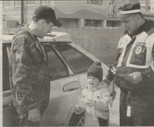
БАЛАЛАР ХАТЛАРЫН ШОФЕРЛАРГА ҮЗЛӘРЕ ТАПИШ