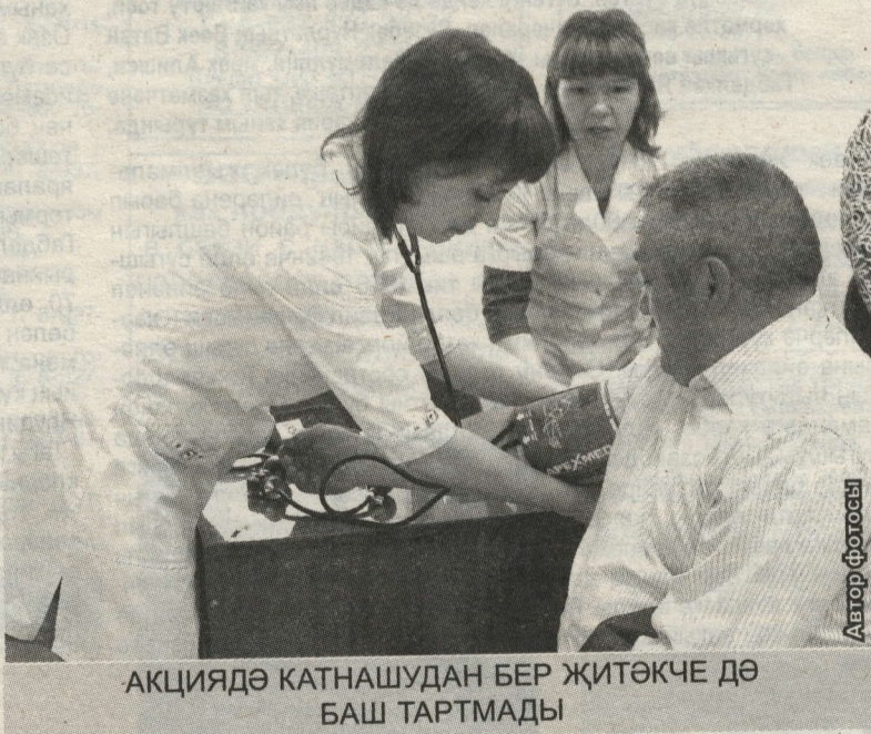
АКЦИЯДӘ КАТНАШУДАН БЕР ЖИТӨКЧЕ ДӘ БАШ ТАРТМАДЫ