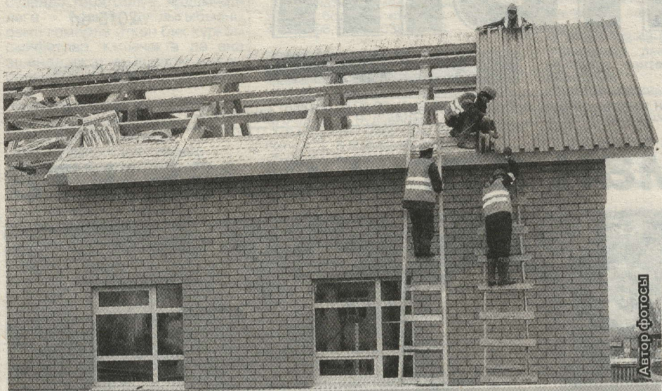
КАРАВЫЛ ТАВЫНДАГЫ МФЦда КЫЗУ ЭШ БАРА

Агымдагы елда районда күпфатирлы йортларны һәм мәгариф объектларын капитал ремонтлау программасы кысаларында 3 белем биру учреждениесе, 15 күпкатлы торак йортта ремонт эшләре бара. Моннан тыш, районда ике социаль-мәдәни объект – Каравыл Тавында күпфункцияле үзәк һәм шәһәрнең Төньяк-Көнчыгыш микрорайонында балалар бакчасын төзелеш килә. Элеге объектларда да ремонт һәм төзелеш эшләре ел башыннан бирле алып барыла.