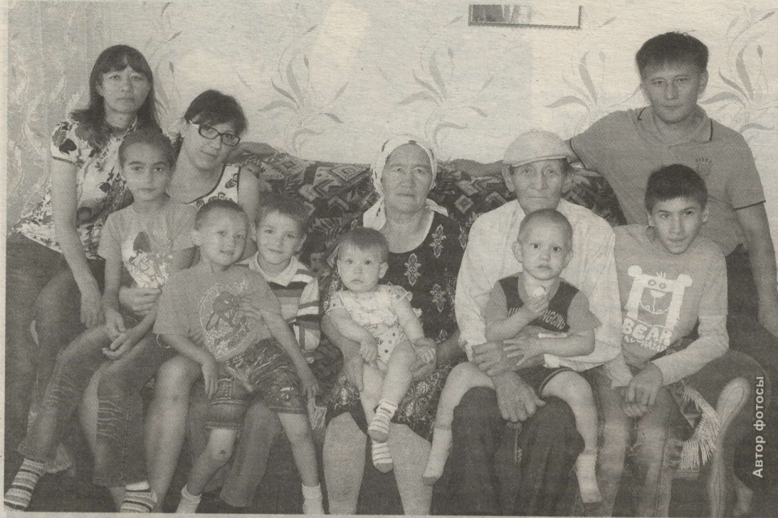
АЛЕКСАШКИННАР ГАИЛӘСӘ РЕСПУБЛИКА КӨНЕНӘ КАЗАНГА ЖЫЕНА

Районыбызда мөхәббәт һәм татулыкта яшәүче, район хакына хезмәт итүче үрнәк гаиләләр бихисап.