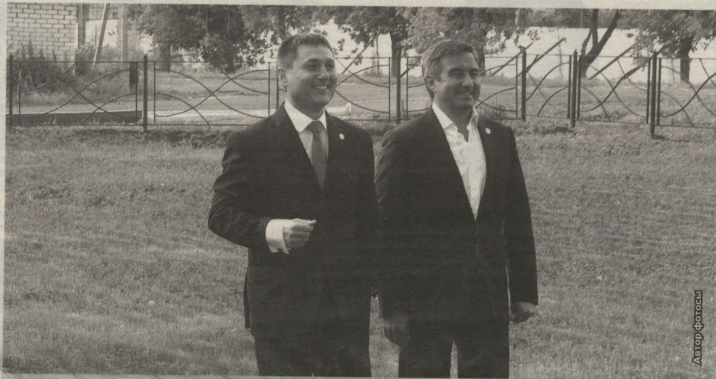
"ДУСЛЫК" ПАРКЫ ТР ВИЦЕ-ПРЕМЬЕРЫ ВАСЫЙЛ ШӘЙХРАЗИЕВТА УҢАЙ ТӘЭСИР КАЛДЫРДЫ

Татарстанда быел Рәстәм Миннеханов инициативасы белән игълан ителгән Парклар һәм скверлар елы кысаларында пәйда булырга тиешле 143 заманча ял зоналарының 5се – Нурлатта.