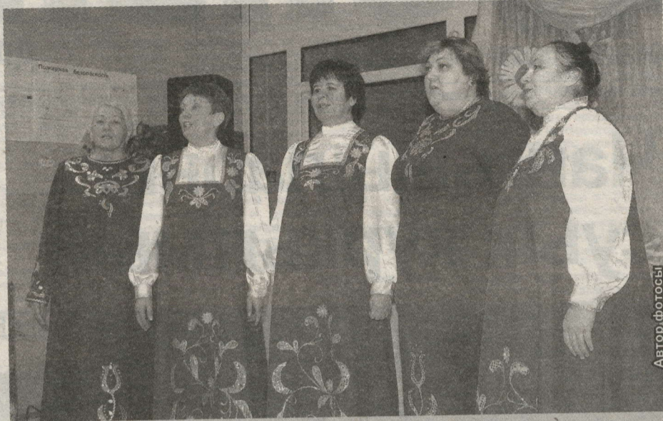
Сәләнгештә жыйен алдыннан авыл үзешчәннәре концерттын яратып карадылар