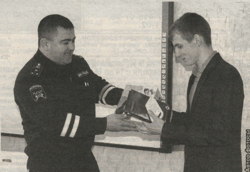
РӘМИСКӘ БҮЛӘКНЕ ЮХИДИ ИНСПЕКТОРЫ ТАПШЫРДЫ