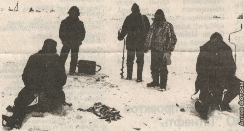
ВАКЫТЛАРЫ БУЛДЫМИ – БАЛЫКЧЫЛАР БУАГА АШЫГА