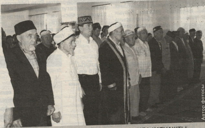
РАЙОН БАШЛЫГЫ БӘЙРӘМ НАМАЗЫНДА КАТНАШТЫ

Узган атнада районның барлык мәчетләрендә дә Ураза гаите уңаеннан бәйрәм намазлары узды.