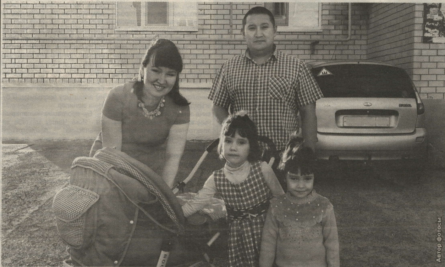
СӘЛАХОВЛАР ГАИЛӘСЕ ҮЗ ЙОРТЛАРЫ ЯНЫНДА