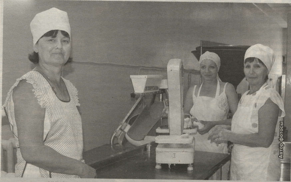
ИКМӘК ПЕШЕРУЧЕЛӘРГӘ БЕР ДӘ ТИК ТОРЫРГА ТУРЫ КИЛМИ