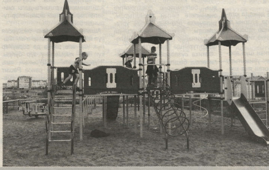
МӨЙДАНЧЫК – БАЛАЛАРЫНҖ ЯРАТКАН УРЫНЫ

Уртача зурлыктагы бер агач төүлеккә 3 кеше суларлык килә – лорд булуп чыгара. Шәһәрдә ишегалларына утыртылган һәр агач 5-10 процент тышкы тавышны йота.