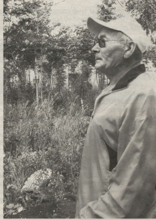
НӘЖИБУЛЛА ХӘМИДУЛЛИННЫҖ ПЛАННАРЫ ЗУР

Шәһәрдә яшел зоналарны арттырып, яшь һәм сәләмәтлек өстөүче тынгысызлар да бар, әлбәттә. Шундыйларның берсен без Ипподром урамында очраттык. Бу – яңа урам, йортлар әле төзелеп кенә килә. Ө менә гажәеп зөвык белән ясалган чөчөкләктән (үпкөләмәсенәр!) безнең транспорт божралары да көнләшәрелек. Төрле төсләргә буялган машина тәгәрмәчләре ярдәмдә зоналарга бүлгән чөчөкләкнең таш түшәлгән сукмагы да, дистәдән артык төрдә чөчөкләр дә, жимеш агачлары да бар. Авторы кем дисезме?