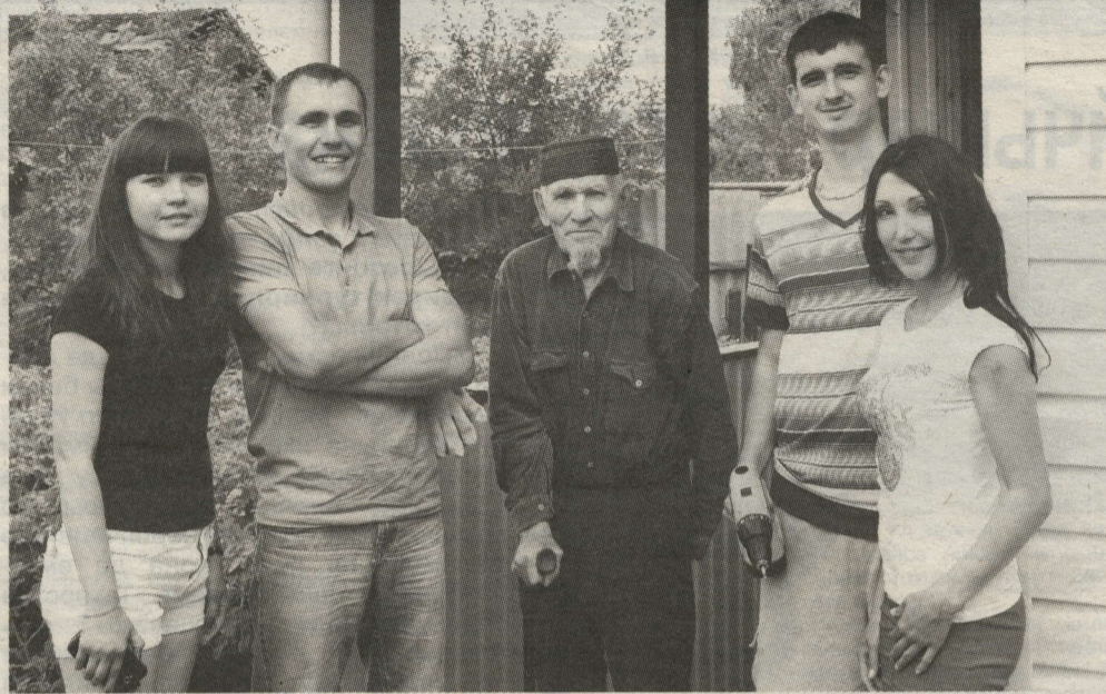
НЕФТЬЧЕ ЯШЫЛӘР ВЕТЕРАН ЯНЫНДА