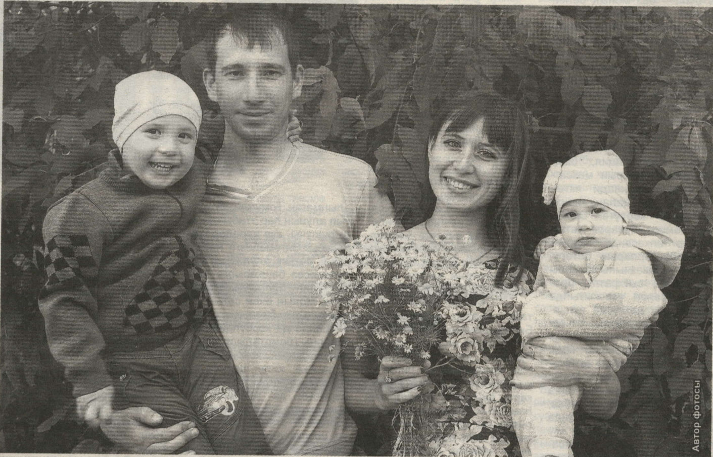
ӘБДЕЛГАЛИЕВЛАРГА “ДУСЛЫК” ФАТИХА БИРДЕ

Бүген илебездә – Гаилә, мәхәббәт һәм тугрылык көне. Бу бәйрәм 2008 елдан бирле билгеләп үтелә һәм ул шул көннең символы булган ромашка кебек популярлык казануырга өлгерде инде. Ромашка гаилә назын һәм бәхетен чагылдыра.