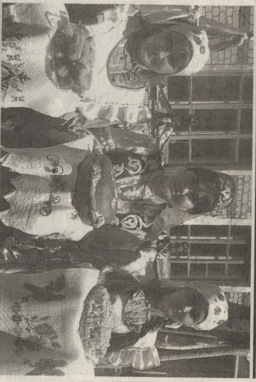
САБАНТҮЙ КУНАКЛАРЫН ИКМӘК БЕЛӘН КАРШЫ АЛДЫЛАР