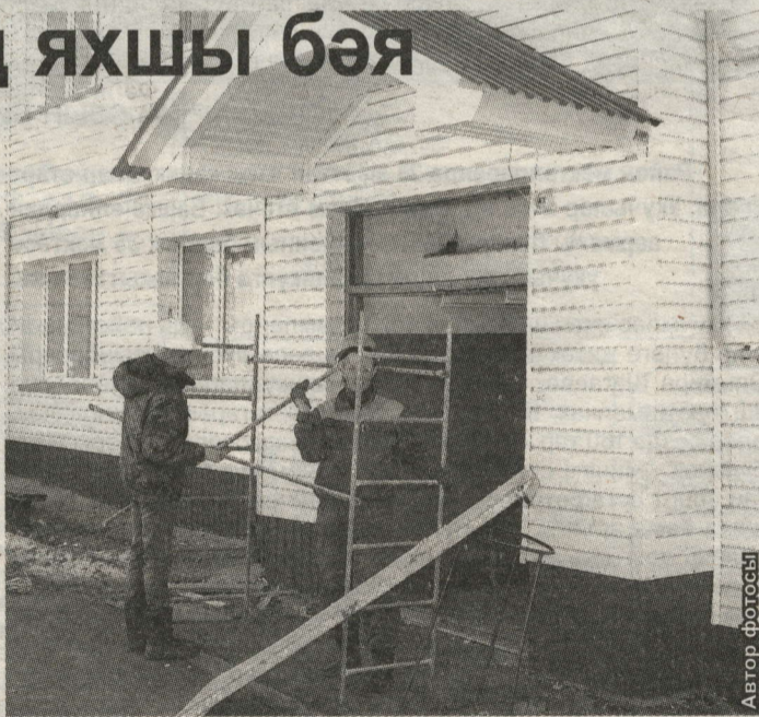
КИЧӨ ГЫЙМАТДИНОВ УР., 47НЧЕ ЙОРТТА ИШЕКЛӨР КУЯ БАШЛАДЫЛАР

- “Домстрой” эшчеләрен яхшы сүзләр белән генә исә алабыз,