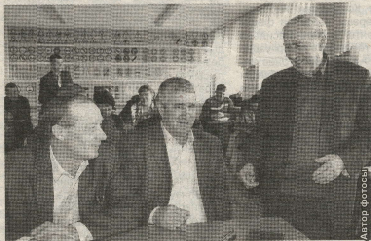
УКУЛАР КУП ТЕМАЛАР БУЕНЧА БЕЛЕМНӨРНЕ АРТТЫРЫГА МӨМКИНЛЕК БИРДЕ.