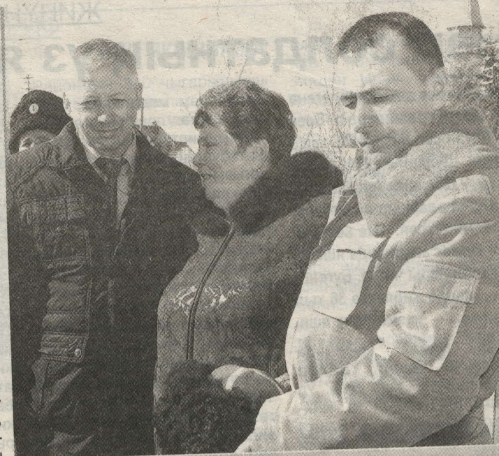
САНИЯ НӘБИУЛЛИНА РӘИСНЕҢ ХЕЗМӨТТӨШЛӨРЕНЭНЭЛӨРЕ КЕБЕК ЯКИН КҮРӘ.

- Бирегә берәүне дә мәжбүрләп китермәгәннәр. Барысының да йөрәк кушуы буенча килүләре