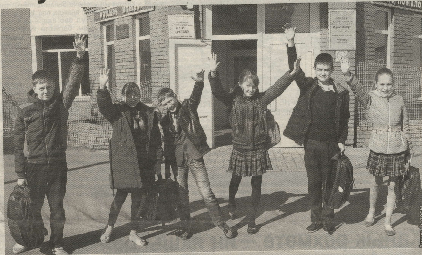
УКУЧЫЛАР ИҢ ОЗЫН ЧИРЕКТӘН СОҢ ЯЛГА КИТӘ

Район мәктәпләрендә 23 марттан язгы каникуллар старт ала. Укучылар өчен ял 9 көн дәвам итәчәк. Башка еллардан аермалы буларак, быел районның барлык 35 мәктәбе укучылары да язгы каникулга бер вакытта чыга.