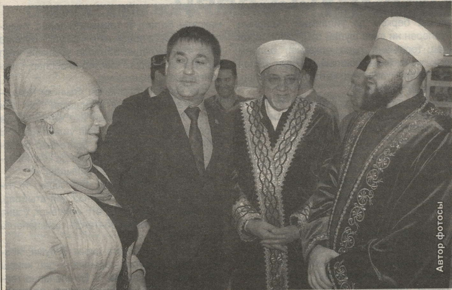
ЭШЛЕКЛЕ АРАЛАШУ БАРА