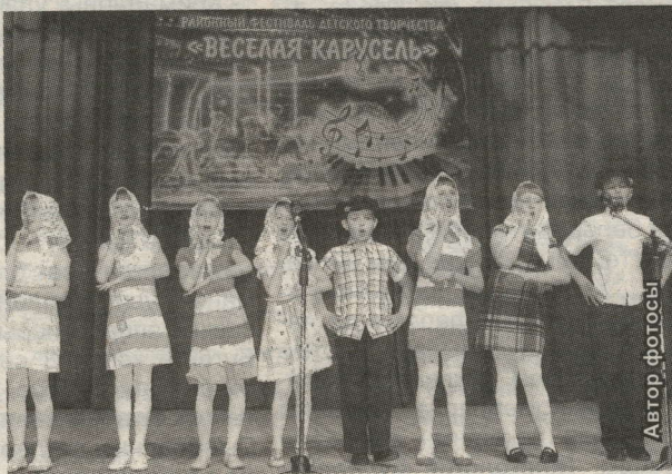
СӘХНӘДӘ — "НЕПОСЕДЫ" ТӨРКЕМЕ