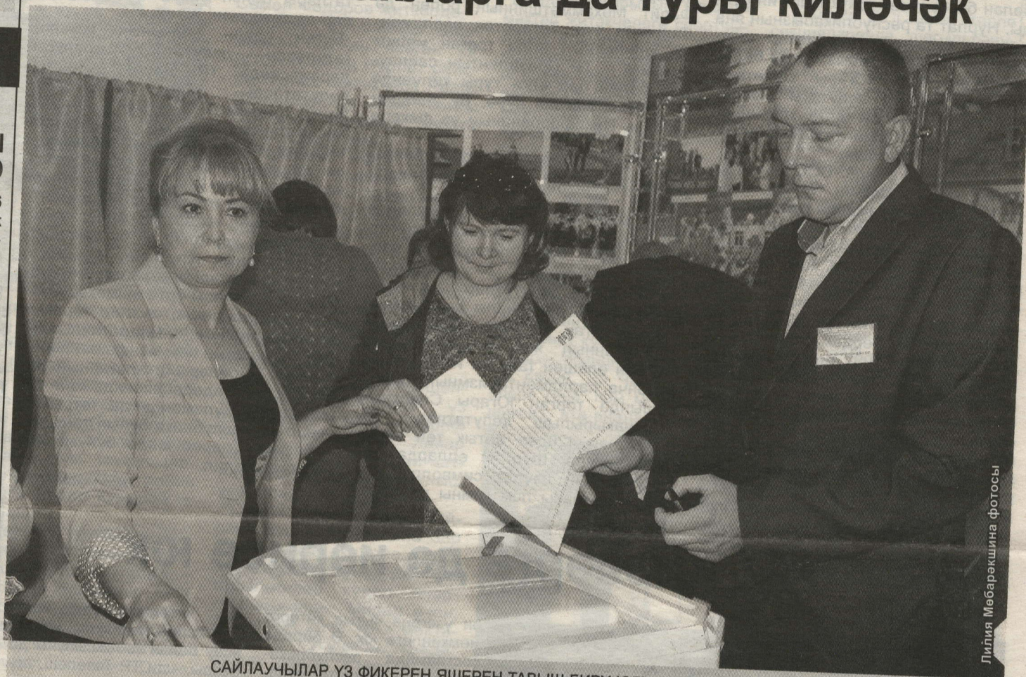
САЙЛАУЧЫЛАР ҮЗ ФИКЕРЕН ЯШЕРЕН ТАВЫШ БИРҮ ЮЛЫ БЕЛӘН БЕЛДЕРДЕ

Муниципаль сайлаулар алдыннан районда партия эчендәге алдан тавыш бирү эшчәнлегенә кысаларында кандидатларның сайлап алучылар белән очрашулары кичә тәмамланды. Узган җомга көнне ул Нурлат шәһәренең үтте.