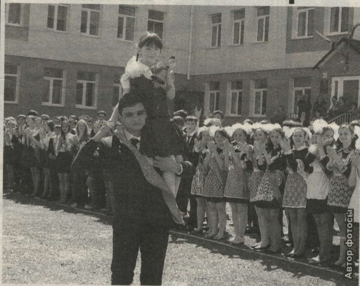
МӘКТӘП БЕЛӘН ХУШЛАШУ БИЛГЕСЕ – “СОҢҒЫ КЫҢҒЫРАУ” ЧЫҢЛЫЙ

Узган атнада районның 330 чыгарылышы өчен соңгы кыңгырау чыңлады.