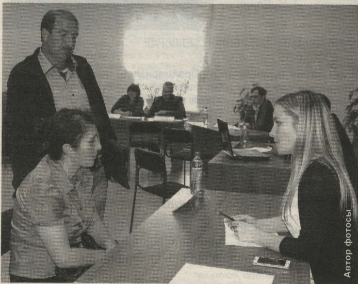
ЯКУШКИНОДА КАБУЛ ИТҮГӘ 34 КЕШЕ КИЛДЕ

Күршеңнең участогында зур умарталык булып, бал кортлары иркенләп яшәргә комачауласа, нишләргә? Ике күрше янәшә утырып кына бу мәсьәләне уңай хәл итә алмыйлар, һәм атна азагында районда юридик ярдәм күрсәтү буенча мәгълүмати-консультацион төркем эшлисен белгәч, белгечләргә мөрәҗәгать итәләр.