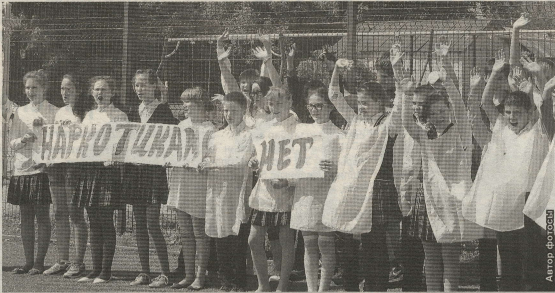
ЯШЬЛӘР ҮЗ ФИКЕРЛӘРЕН АКЦИЯДӘ БЕЛДЕРДЕ