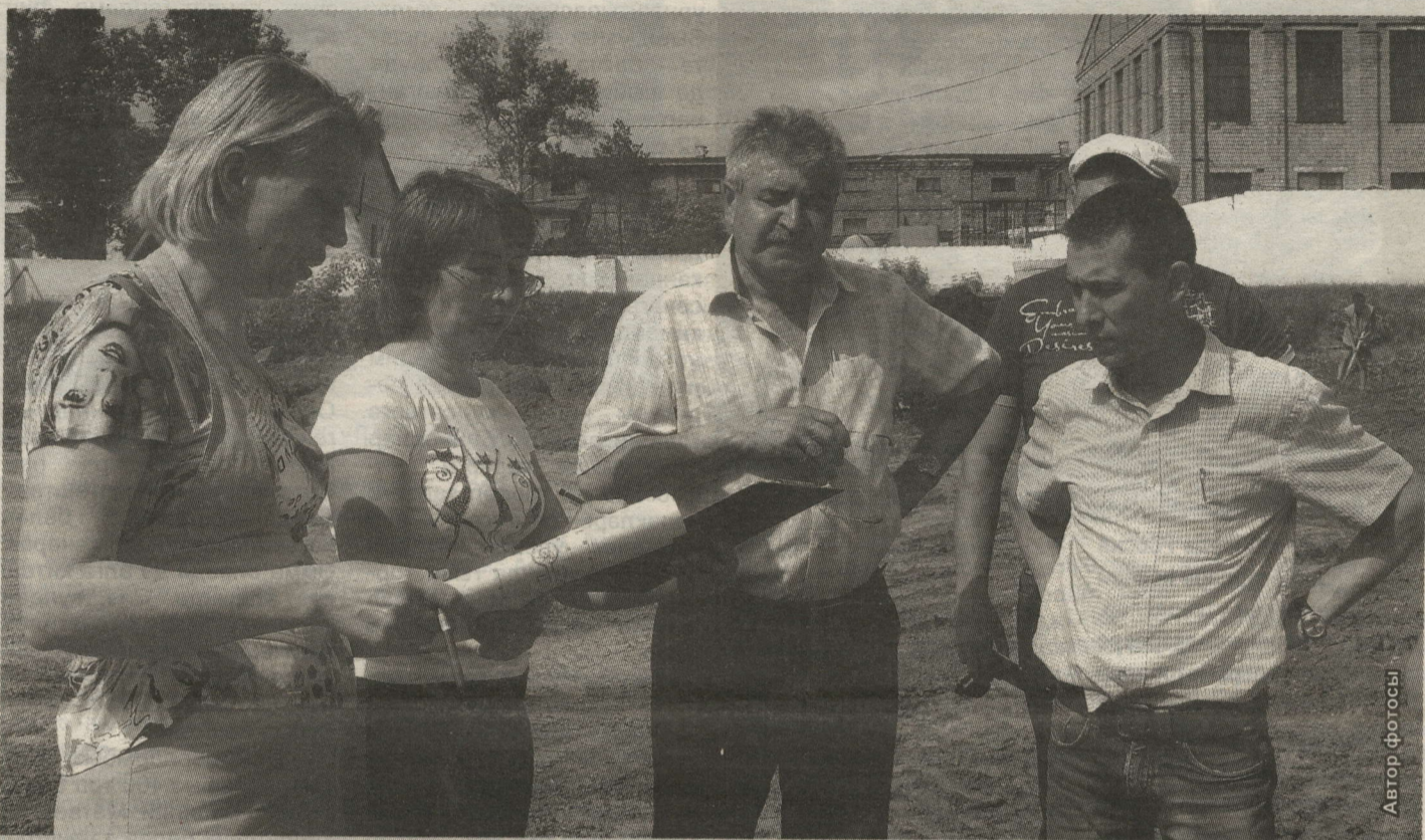
БАШКАРМА КОМИТЕТ ҺӘМ ПОДРЯДЧЫ ОЕШМА БЕЛГЕЧЛӨРЕ КӨН САЕН УРЫНДА ОЧРАШАЛАР

Бүген шикәрчеләр микрорайоны халкының күз алдында яңа сквер туып килә, ул районыбызда яшәүче халыкларның бердәмлеген һәм милләтара татулыгын чагылдырып торачак.