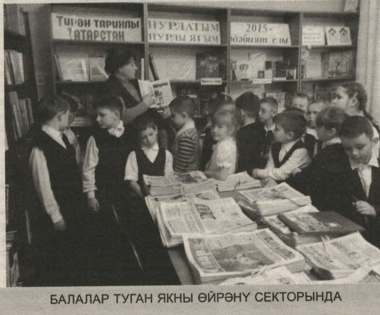
БАЛАЛАР ТУГАН ЯКНЫ ӨЙРӘНҮ СЕКТОРЫНДА

Газетаның электрон версиясе nurlat-tat.ru да