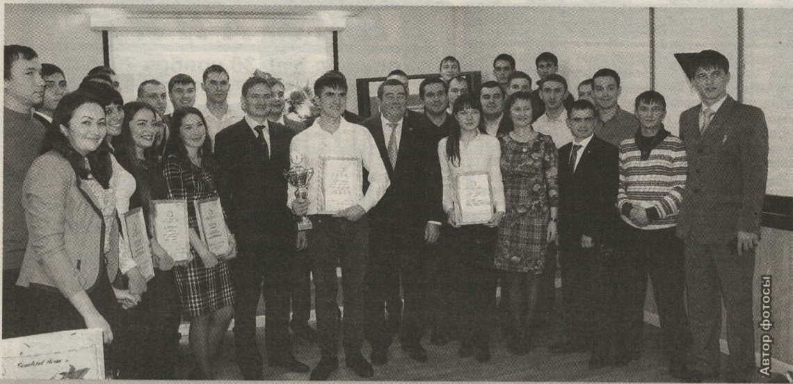
"НУРЛАТНЕФТЬ" НГДУСЫНДА СӘЛӘТЛЕ ЯШЬЛӘР ХЕЗМӘТ КУЯ