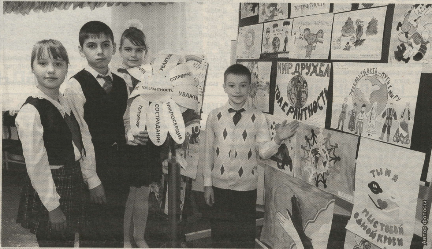
Коррекциаләүче интернат-мәктәп укучылары толерантлык темасына рәсемнәр ясады