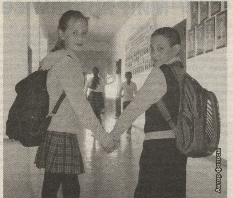
МӘКТӘП СУМКАСЫНЫҢ АВЫРЛЫГЫ БАЛА АВЫРЛЫГЫНЫҢ 10 ПРОЦЕНТЫННАН АРТМАСКА ТИЕШ

2003 елда Россия Госсанэпиднадзори мәктәп дәреслекләренә карата нормалар эшләде. Башлангычлар өчен дәреслекнең авырлыгы иң күбе 300 грамм, 5-6 сыйныфларга — 400 грамм, 7-9 сыйныфлар өчен — ярты килограмм. Өлкән сыйныф