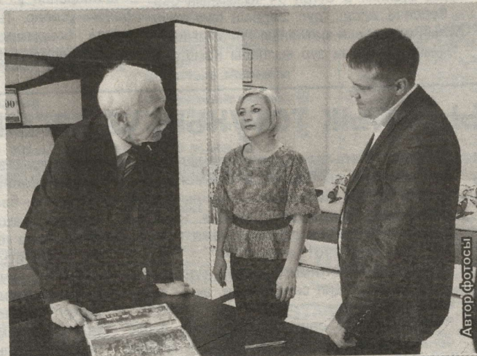
ДӘУЛӘТ ДУМАСЫ ДЕПУТАТЫ ХАЛЫКЛАР ДУСЛУГЫ ЙОРТЫНДА