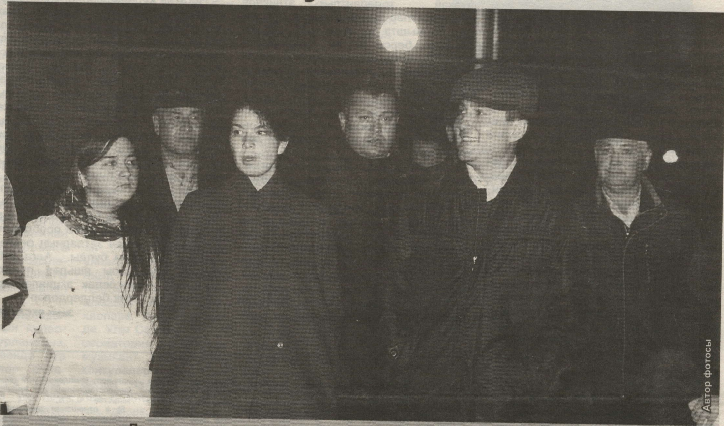
Президент ярдәмчесе шәһәр паркларын һәм скверларны карап чыкты