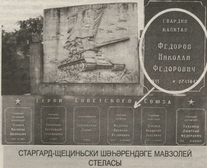
СТАРГАРД-ЩЕЦИНЬСКИ ШӘҺӘРЕНДӘГЕ МАВЗОЛЕЙ СТЕЛАСЫ