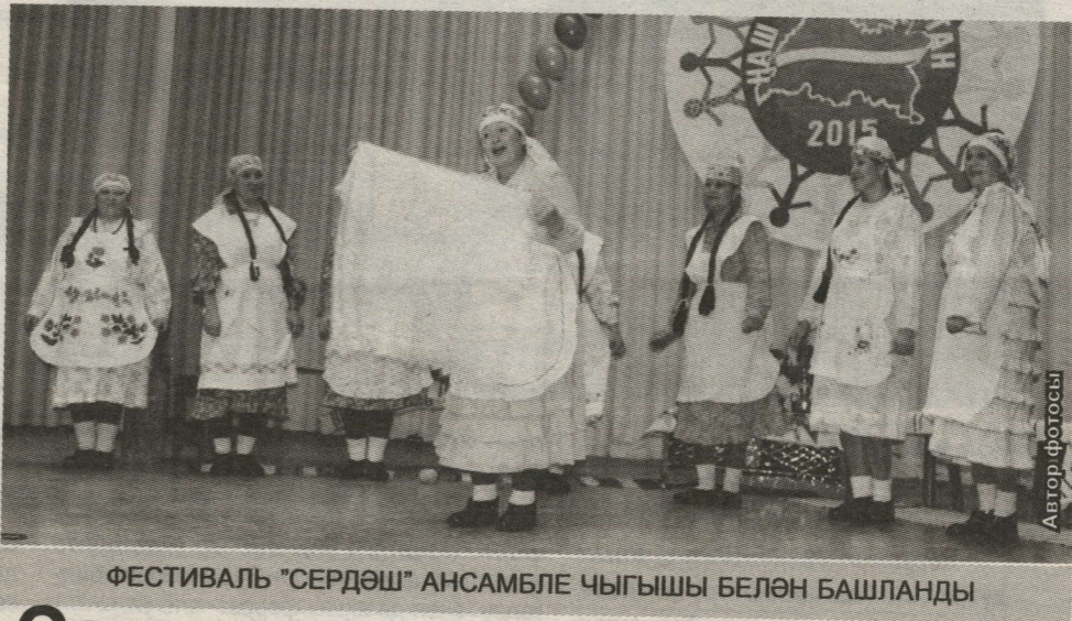
ФЕСТИВАЛЬ “СЕРДӘШ” АНСАМБЛЕ ЧЫГЫШЫ БЕЛӘН БАШЛАНДЫ