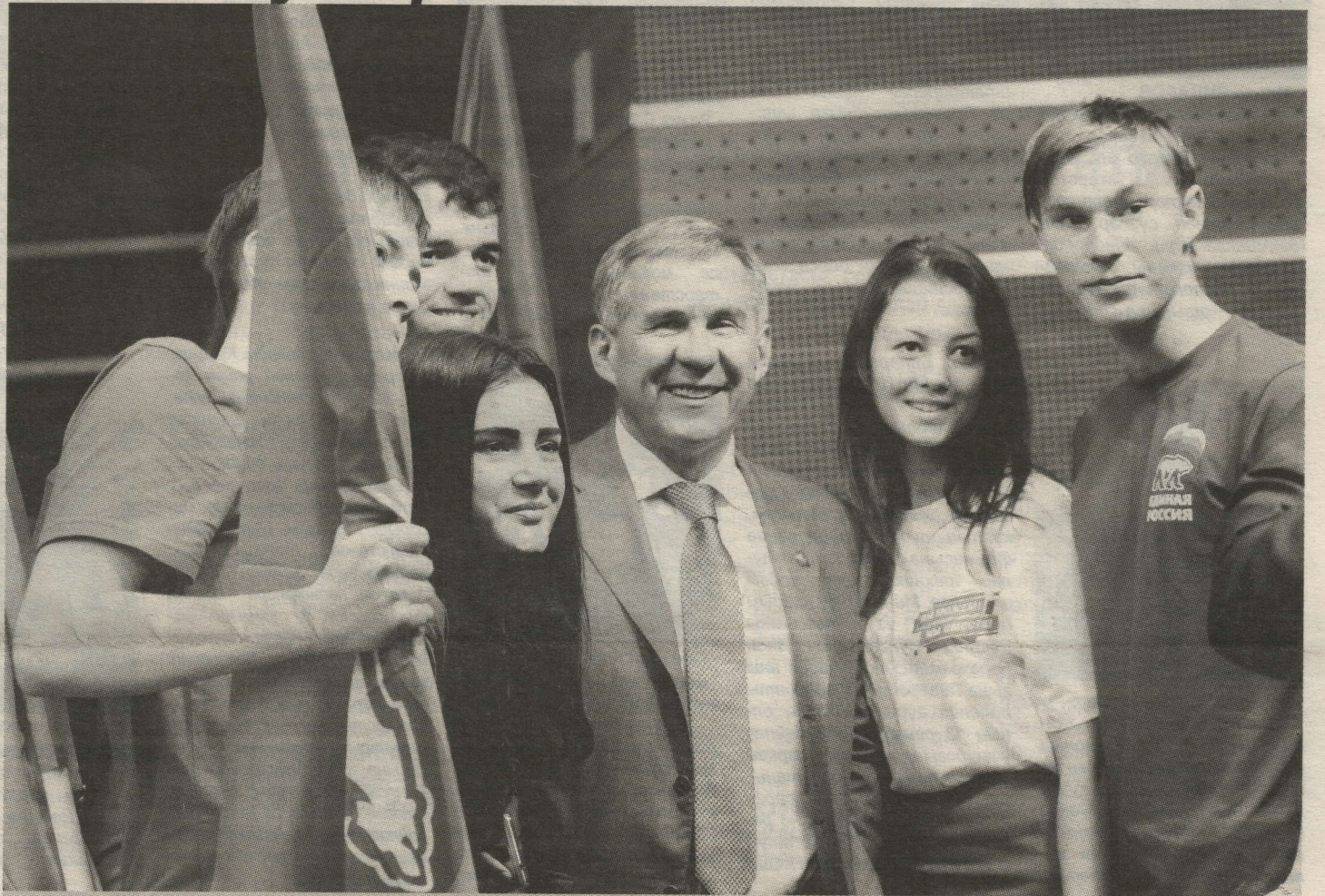
Тулырак "Атна вакыйгалары"нан укыгыз