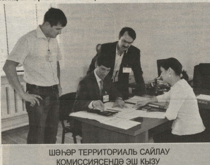
ШӘҺӘР ТЕРРИТОРИАЛЬ САЙЛАУ КОМИССИЯСЕНДӘ ЭШ КЫЗУ